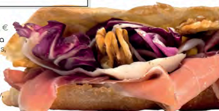
36. re di roma

speck, gorgonzola, radicchio, noci speck, gorgonzola cheese, red chicory, walnuts