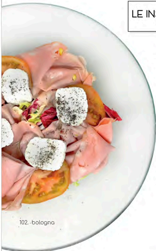
102. - bologna

102 BOLOGNA ..... 9 € insalata mista, mortadella, primo sale, pomodori, pepe mixed salad, mortadella, first salt cheese, tomatoes, pepper