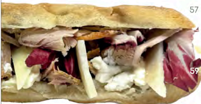
59. san lorenzo

baked ham, smoked provola cheese, truffle sauce, fresh tomato, mixed salad