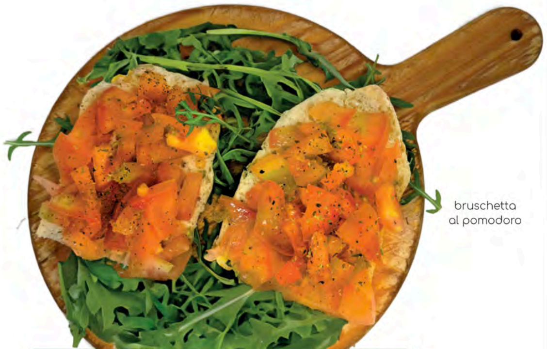
bruschetta al pomodoro

Abbina ad una insalata una porzione del nostro pane BIO, scegliilo tra il bianco il nero o la pizza. Match a portion of our BIO bread to a salad, choose between white, black or pizza.